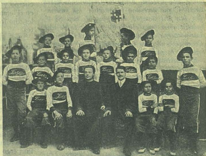
CHIERI — La Leo.

Viedma (Patagonia). — También resultó muy bella la fiesta del Protector de la Juventud. Hubo triduo solemne, y la afluencia de niños á los Santos Sacramentos fué una prueba palpable de su amor