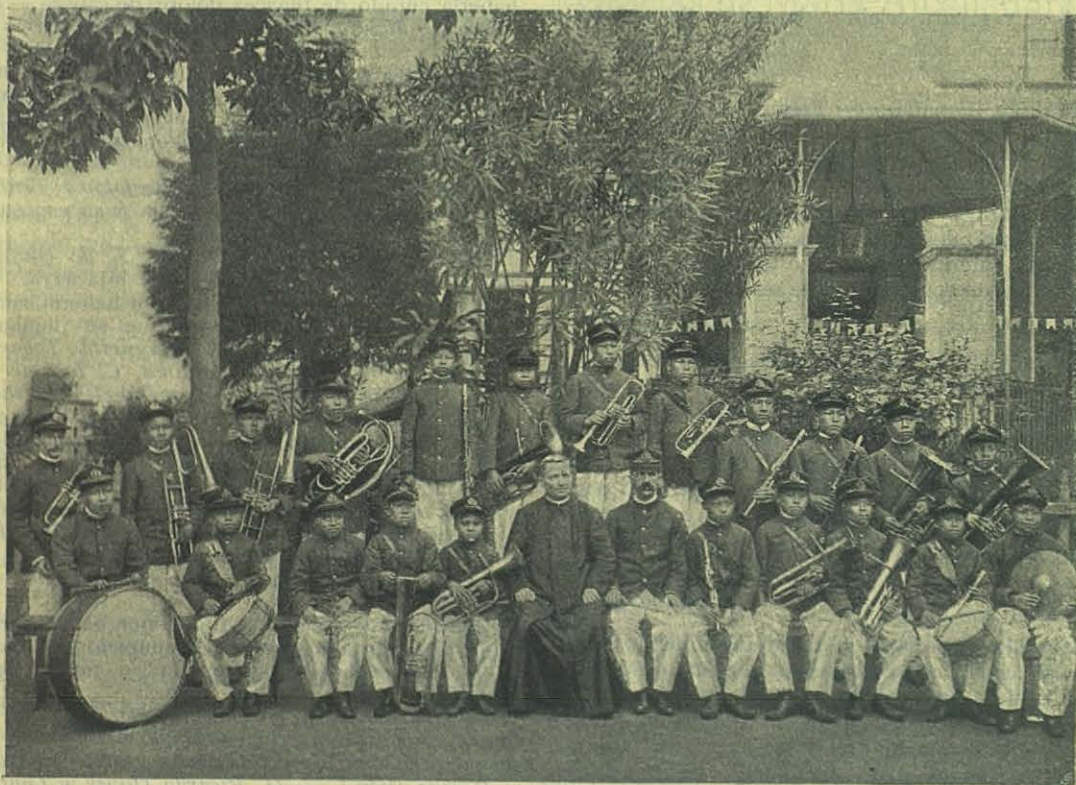
La Banda de los pequeños Bororos á la Exposición de Río Janeiro.