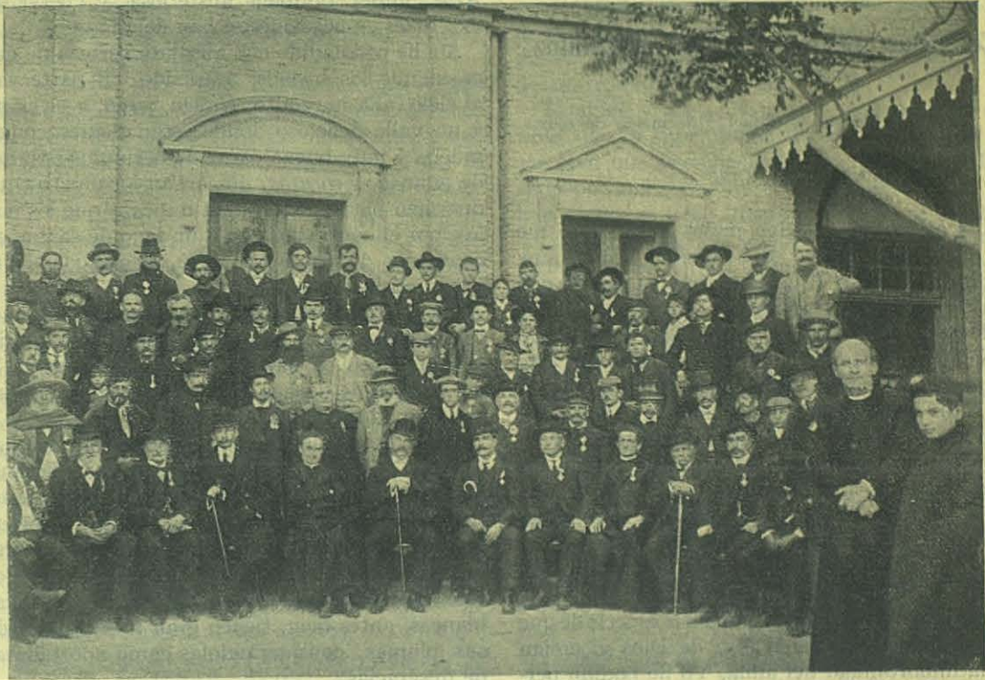
Circulo de Obreros Católicos de Viedma y Patagones.

Barranquilla (Colombia). Fiesta de San Luis. — Los jóvenes de la Asociación de San Luis Gonzaga y los niños de la Escuela Salesiana y del Oratorio Festivo honraron al Angélico Santo con un fervoroso triduo durante los días 16, 17 y 18 de Julio, y el 19 completaron la obra con una numerosa comunión y una misa solemne, cantada por los mismos niños y acompañada por los instrumentos de varios antiguos alumnos,