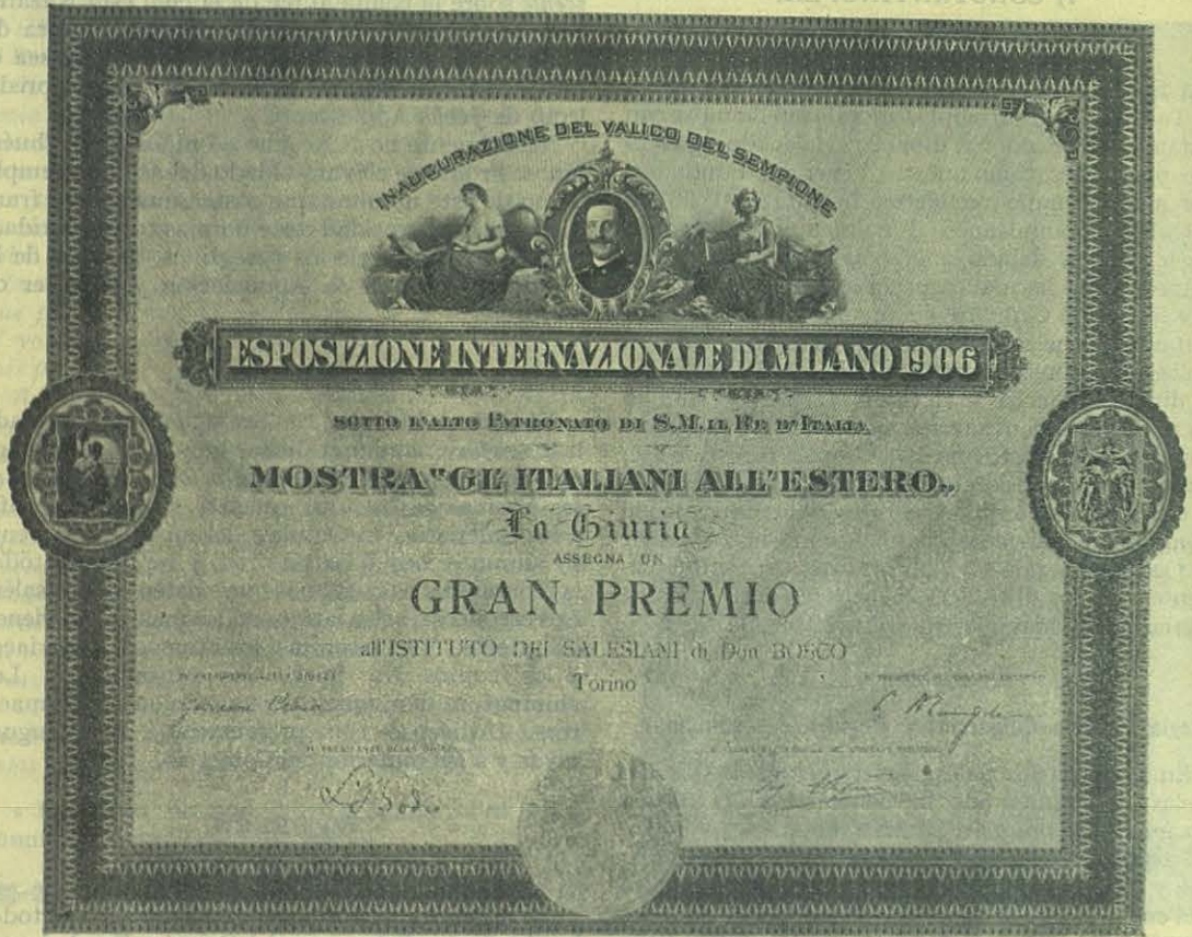
Diploma adjudicado á la Obra de Don Bosco en ocasión de la Exposición Internacional de Milán.

Hay un trabajo que se impone; es á más de humanitario, indispensable: secar una laguna limitrofe, causa perenne de fiebres palúdicas, á las cuales han sucumbido muchas familias musulma-