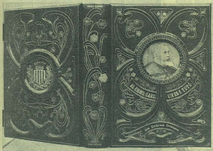
El álbum presentado al Emmo. Sr. Cardenal Vives y Tutó. (Trabajo de la Escuela de Sarrià Barcelona).

Aquí tenéis, ó mejor, aquí tenemos Cooperadores y amigos, la Obra de los Salesianos: favoreciéndola con nuestro dinero, con nuestras influencias, con nuestras simpatías como podemos, haremos un gran bien á la Sociedad y, como el Venerable, « en todas nuestras obras daremos alabanza al Santo de los Santos. »