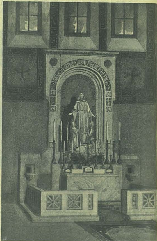
ROMA — Iglesia de Sta. María Libertadora. El monumento de la niñez al Sgdo. Corazón de Jesús.

Es un grupo de mármol, representando á Jesús Redentor de los niños en el orden moral, intelectual y social, esculpido por el ya famoso