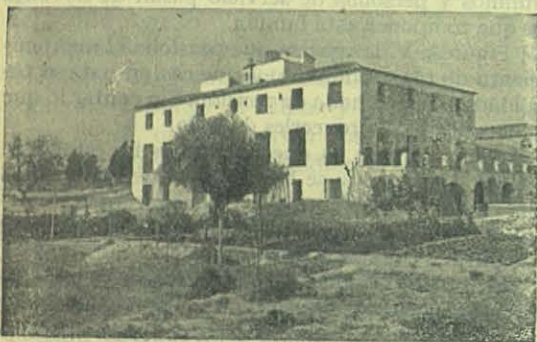
ALICANTE (España) — Casa Salesiana para la Obra de los Hijos de María.

Hicimos todo lo posible para que la fiesta resultara solemne. Hubo á las 7 de la mañana, Comunion general; á las 9 y \frac{1}{2} el nuevo presbítero cantó su primera Misa predicando un elocuente sermón el Salesiano, Rdo. D. Tomás Nervi, demostrando la sublime dignidad del sacerdote católico, y el respeto que se merece de todos.