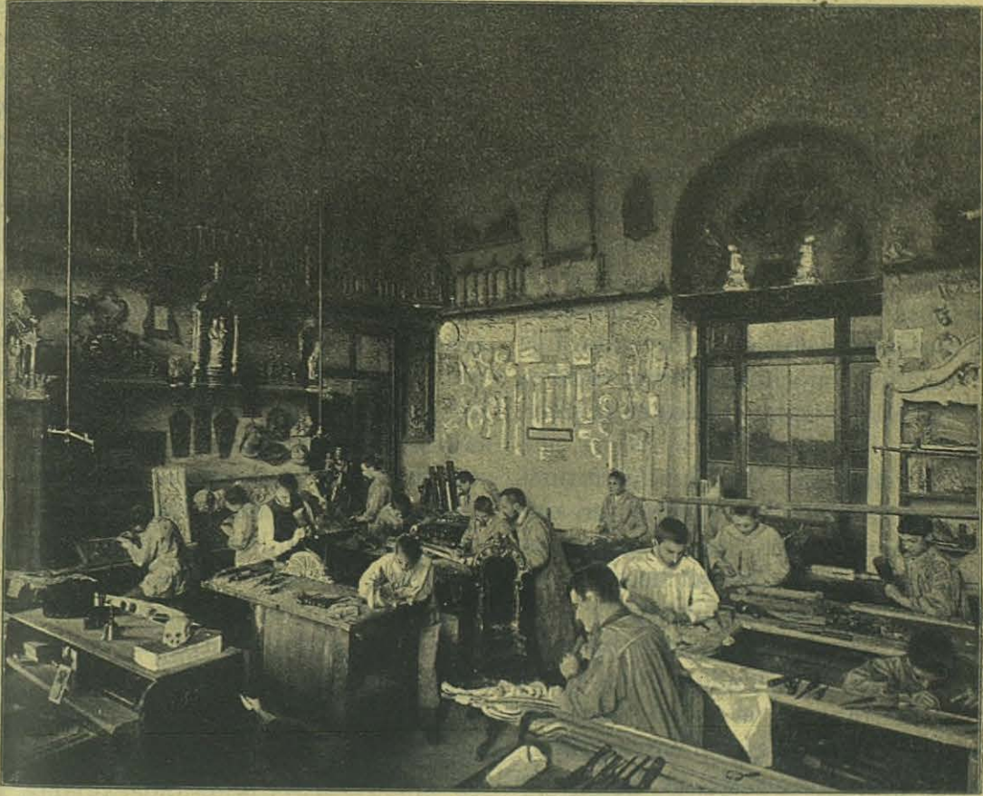
TURÍN (Oratorio) — Escuelas Profesionales (Sección de Escultura).

dos partes: teórico y práctico, alternándose la enseñanza con el trabajo y aplicando lo que oyen.