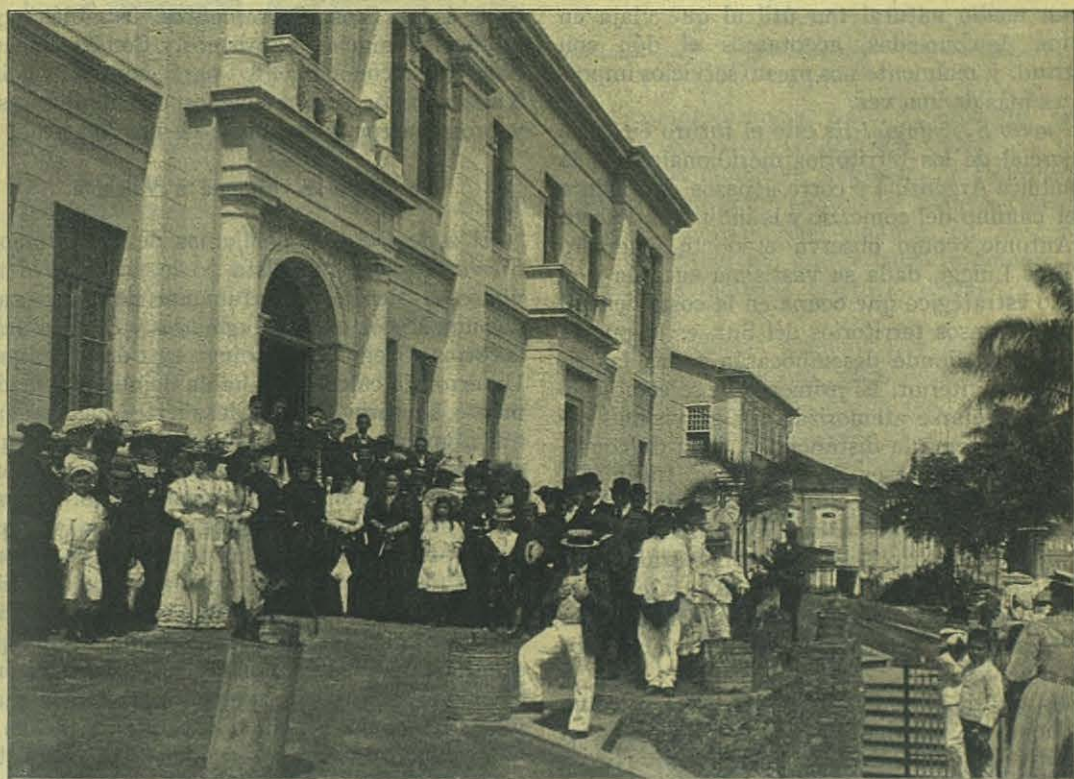
BAHÍA (Brasil) — Después de la inauguración del Comité de Damas de María Auxiliadora.

El bueno y valiente viejo fué admitido á la pri-