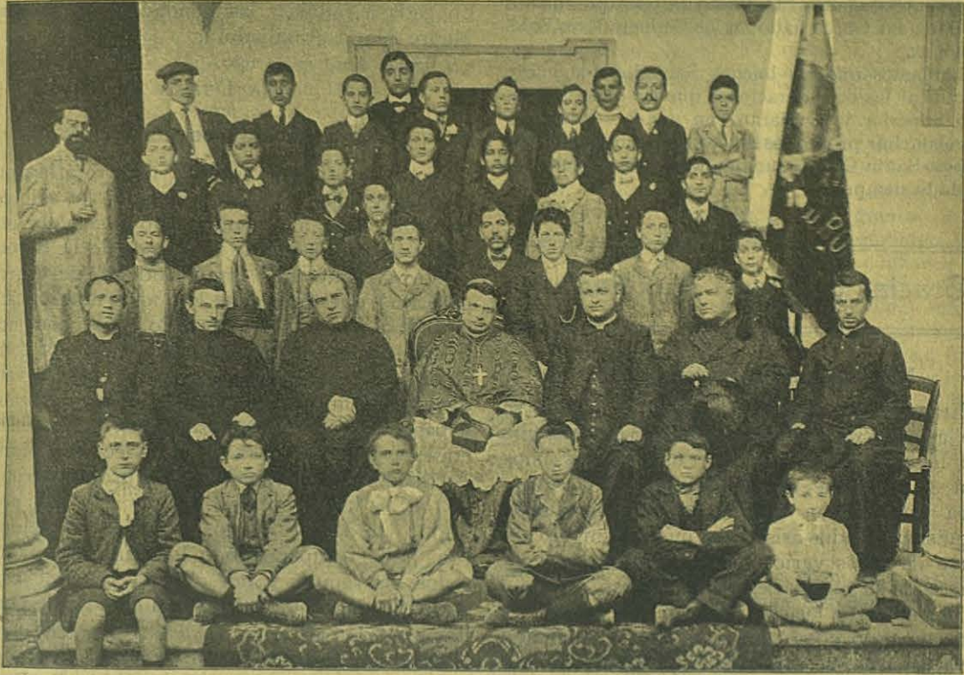
Pisa - Círculo D. Bosco.

Todas las Cooperadoras y personas amigas prepararon con primor las calles por donde pasaría la procesión y se obtuvo así un verdadero triunfo, pues la esbelta y simpática imagen de nuestra Ma-