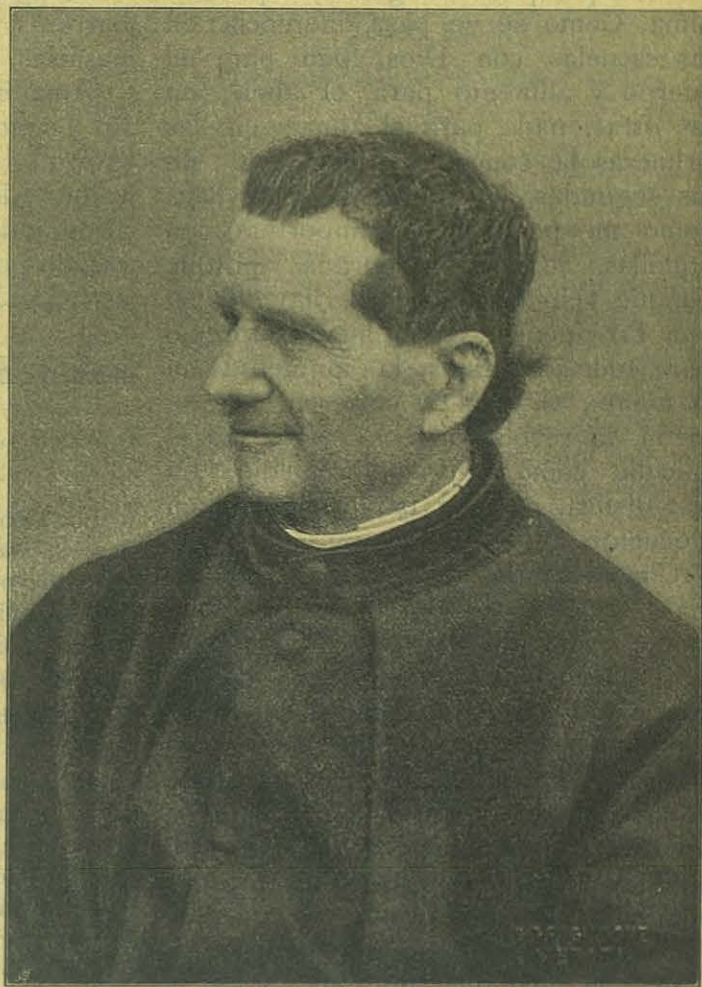
El Venerable Juan Bosco.

que él, cumpliendo la misión que le asignara la Providencia, procuró ganarse la juventud, y sobre todo la juventud popular, para educarla según las máximas del Evangelio y de la sana razón. Su ideal es formar una