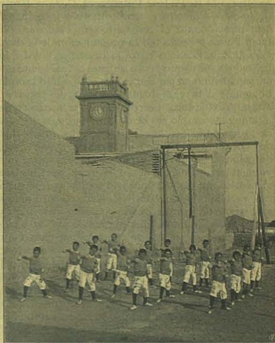
Gimnastas del Colegio Salesiano de Patagones.

« El P. Director dirigió á los concurrentes una calurosa y sencilla alocución, en que les pedía su