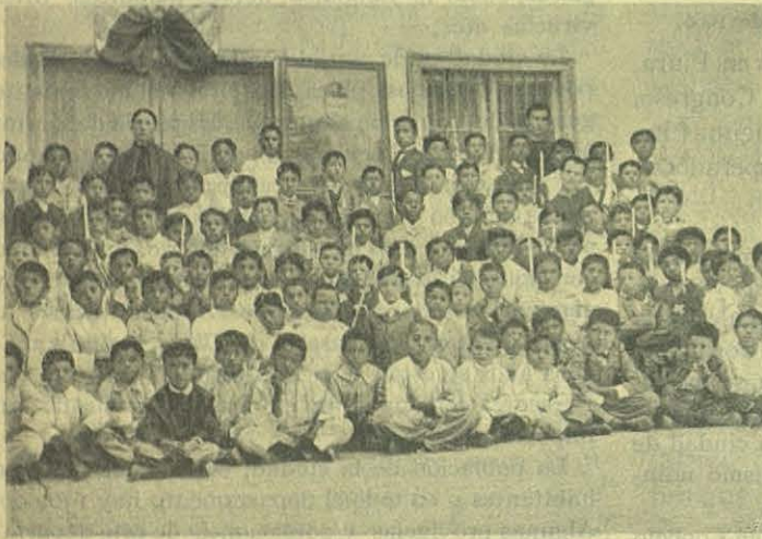
PIURA — Alumnos de primera Comunción.

El Perú con 1.800.000 kms. cuadrados de superficie, apenas tiene 3.000.000 de habitantes; necesita pues, con urgencia la inmigración. Así hallará el