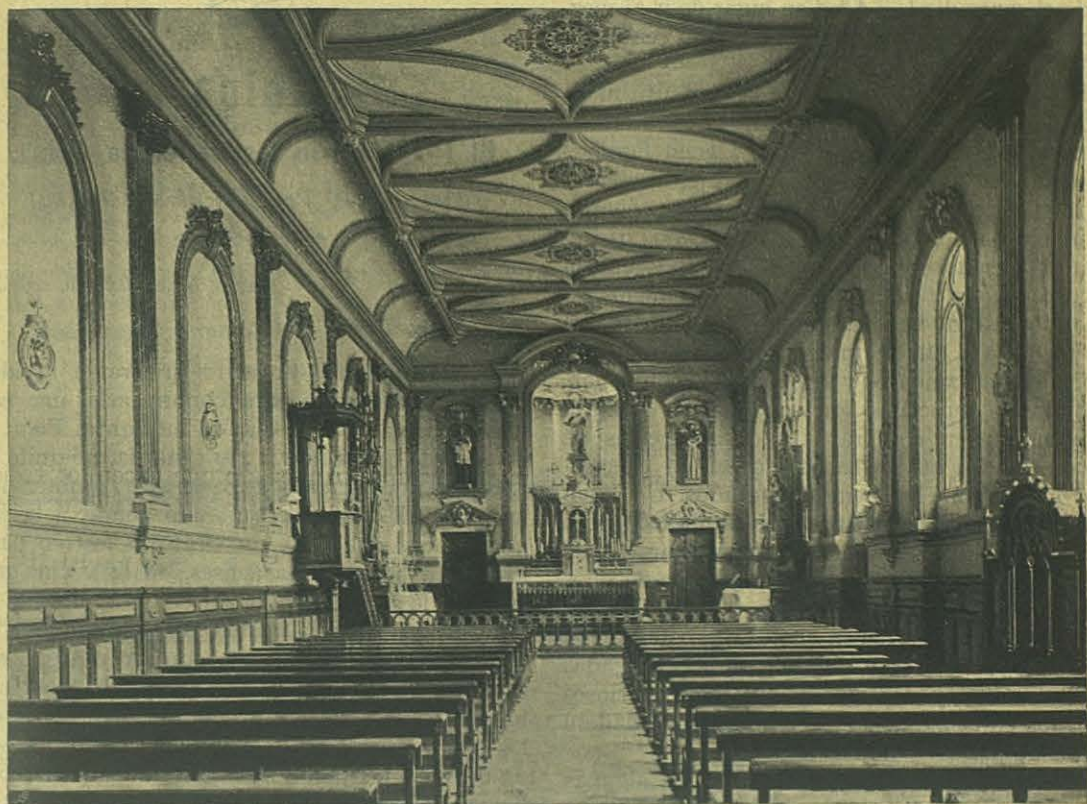
Interior de la Iglesia de María Auxiliadora en Madrid.

Hoy finalmente, 5 de Mayo, pudo satisfacer sus ardentísimos anhelos. Es el primer pagano que hemos tenido la fortuna de bautizar: y si viese, cuán contento está: no sabe cómo mani-