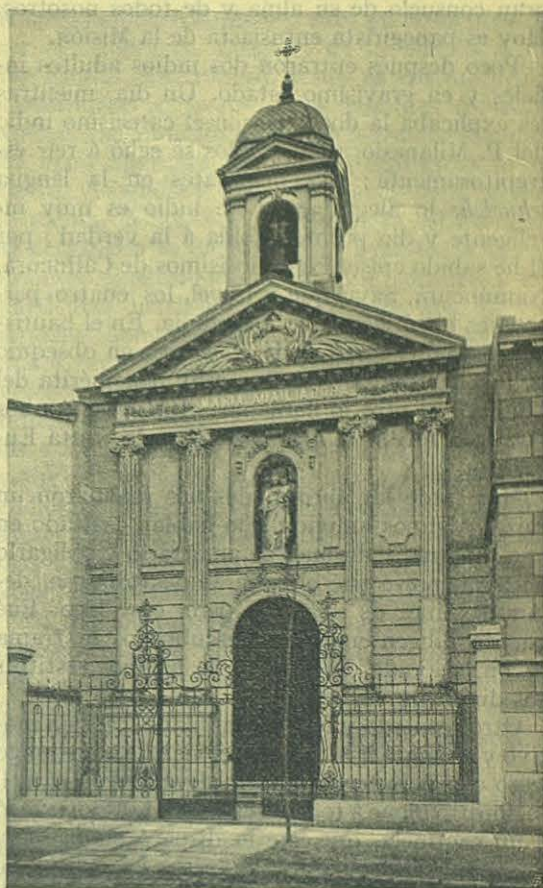
Fachada de la Iglesia de María Auxiliadora - Madrid.

venir mejor. En agradecimiento de tan grandes beneficios, cantamos un solemnísimo Te Deum al tramontar del 1905, y tomaron parte todas las Autoridades, nuestra comunidad y un inmenso pueblo con entusiasmo y compostura dignas de todo encomio.