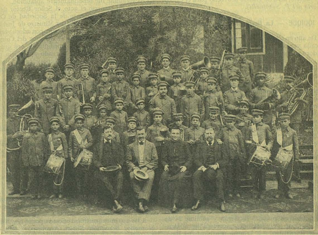
Colegio León XIII — Maldonado - Buenos Aires.

El Mes de María se celebró con mucha piedad por