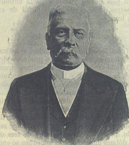
D. Porfirio Díaz.

Las ciencias y las letras son muy cultivadas. Existen 10,222 escuelas primarias y las frecuentan 825,000 alumnos de ambos sexos. Los maestros,