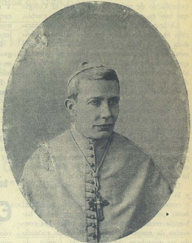
El Emmo. Card. Spínola.

El Capítulo Superior de la Congregación Salesiana y sus miembros todos, envían su más sincero pésame á la Arquidiócesis huérfana, especialmente al venerando Cabildo, y sabiendo que las lágrimas se evaporan, por ardientes y abundantes que sean; oran y piden á sus Cooperadores oraciones por el alma del sincero amigo, del padre generoso.