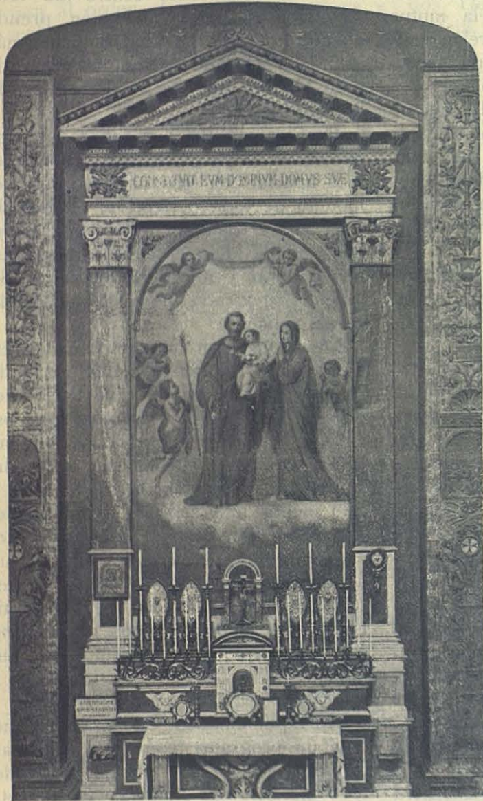
Altar de S. José en el Santuario de María Auxiliadora.

Imitemos nosotros los ejemplos de nuestro Padre: amemos y hagamos amar al Santo Patriarca, copiemos su espíritu de trabajo y su perfecta unión con Dios.