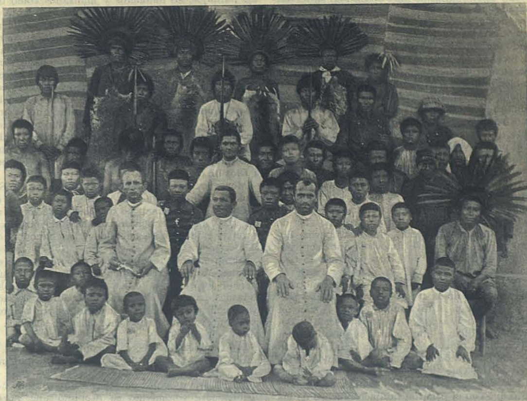
Colonia del Sagrado Corazón.

Cuando fuimos á establecernos allá y construimos el primer rancho, serias y fundadas aprensiones nos amargaban la existencia y amena-