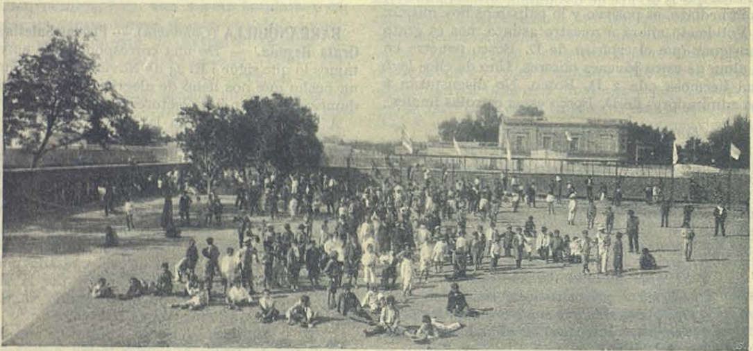
Oratorio Salesiano de Córdoba (Argentina).

Después de un hermoso himno cantado por los niños del Oratorio festivo, el Ilmo. Sr. Obispo, revestido de los ornamentos pontificales, procedió á la solemne bendición de la piedra, que cubierta de flores, se hallaba en el extremo opuesto del patio : de allí fué trasladada por los padrinos y madrinan al lugar de su colocación y se ejecutaron las ceremonias de rúbrica.