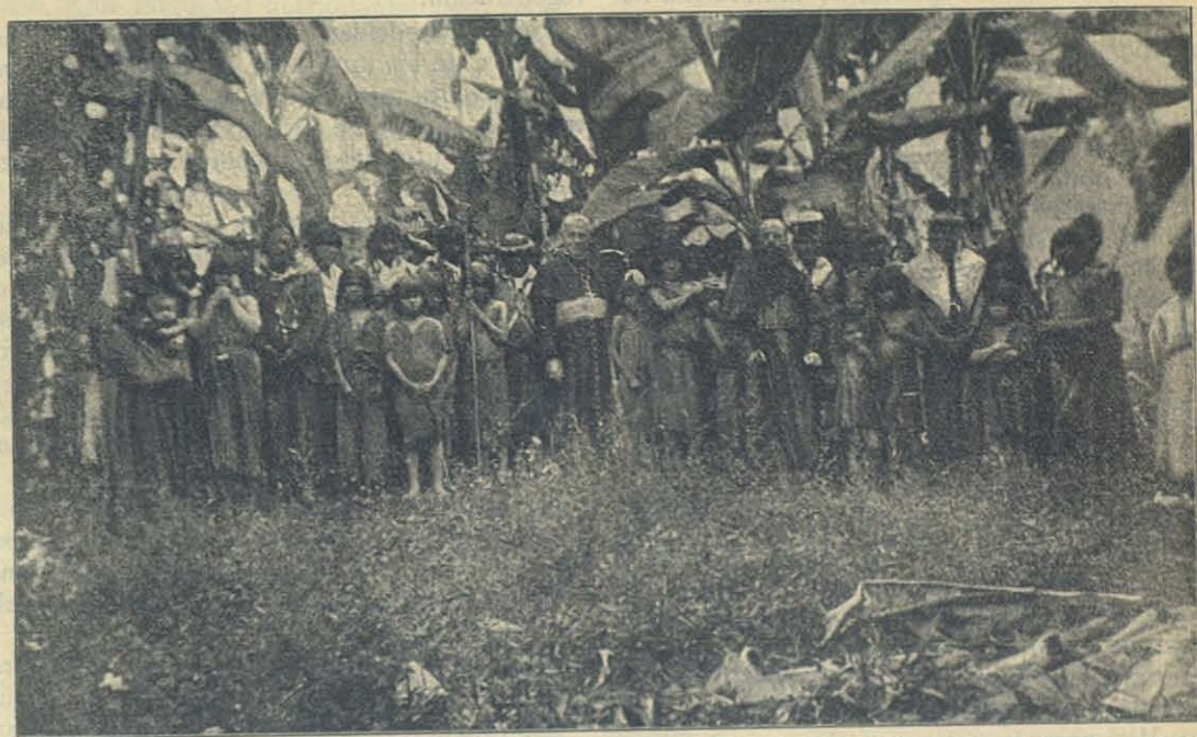
Mons. Costamagna entre los Jíbaros de Gualaquiza — Ecuador.

Al rayar el alba de la sexta y última jornada, el Ilmo. picó á la mula que con presteza se dió á devorar el camino. Los deseos de abrazar des-