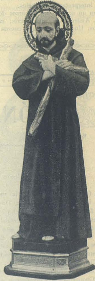
S. Juan de la Cruz.

En vez de ir directamente hacia la iglesia, se dió un rodeo por la plaza. Saludos, sonrisas, felicitaciones, apretones de manos y la policia escalo-