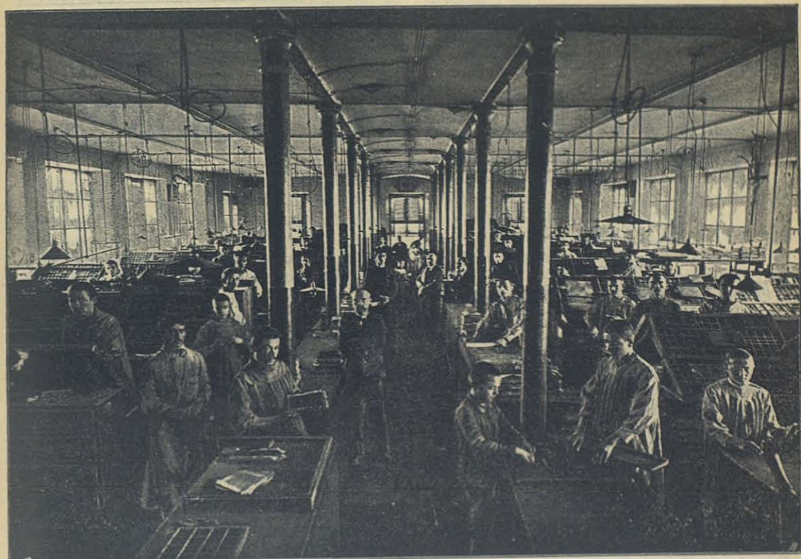
Taller de cajistas en el Oratorio Salesiano de Turin — Italia.

íntimo contacto con los niños, para formar sus inteligencias y sus conciencias, para poner en sus tiernecillas mentes el fundamento de todos los conocimientos literarios y científicos, debe al mismo tiempo infundir en sus almas el espíritu del Cristianismo, que debe entrar en todo y santificarlo todo. Señores, hasta aquí hemos trabajado y luchado por la enseñanza religiosa en las escuelas, y hemos merecido bien; continuemos trabajando y luchando sin dar tregua; no nos