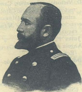
El Excmo. Sr. D. José M. Pando.

LA PAZ (BOLIVIA). — El General D. José M. Pando, ex-presidente de la República de Bolivia, durante el tiempo de su presidencia, dispensó decidido