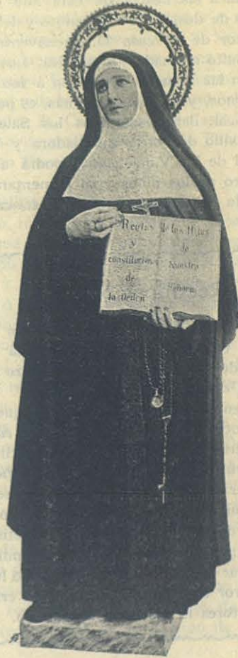
Beata Juana de Lestonnac.

VALENCIA (ESPAÑA). — Nos escriben: « Con el auxilio de Dios algo se ha podido hacer en esta