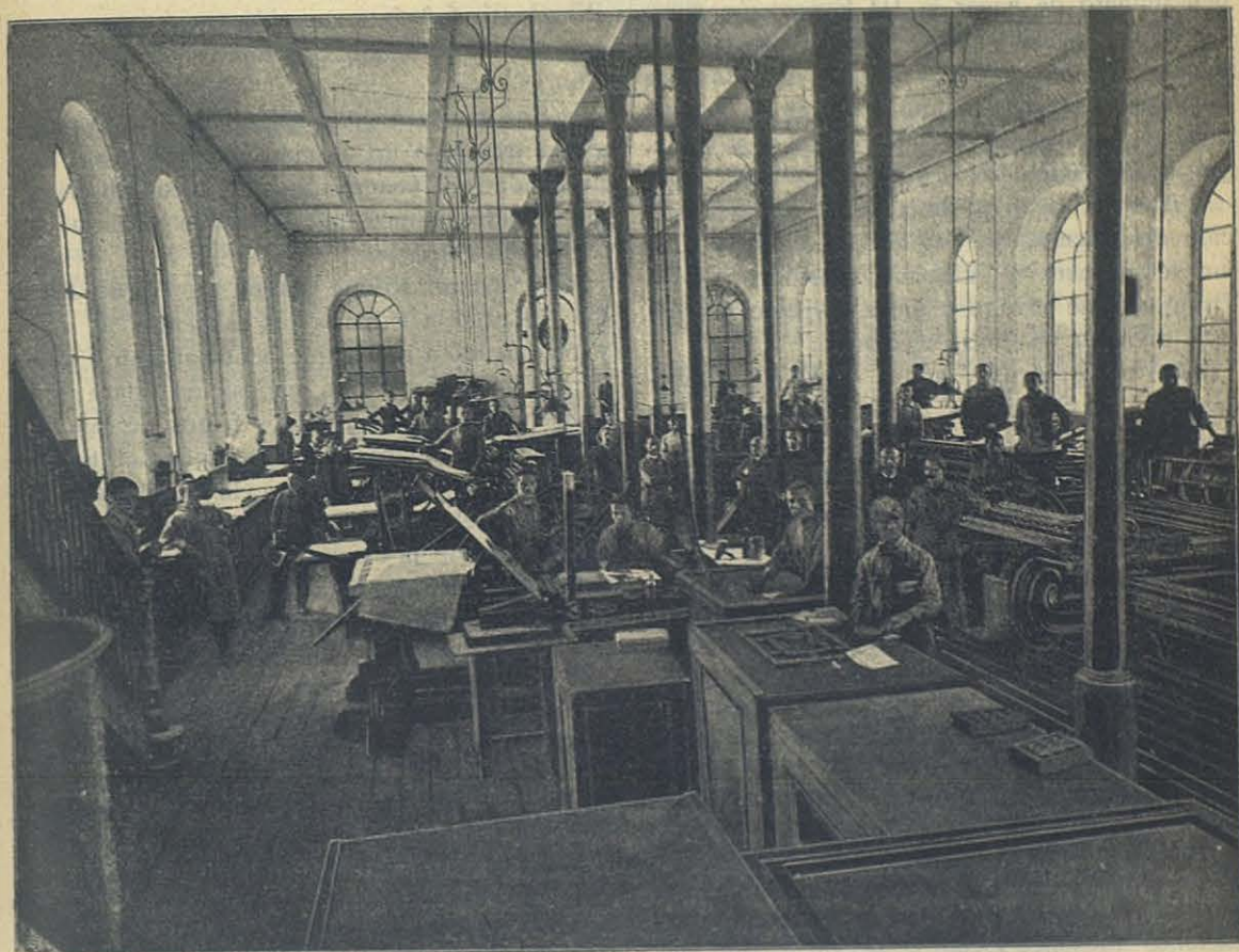
Escuela tipográfica del Oratorio Salesiano de Turin — Italia.

Fué una hermosa fiesta dedicada á los triun-