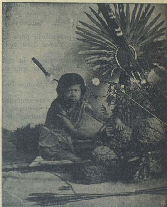
Indio de la tribu de los Coroados (Matto Grosso-Brasil).

Hubieramos nosotros deseado llegarnos á ellos; pero ir con las manos vacías, sin nada que presentarles, no me parecia prudente. Hasta que á principios de este mes aparecieron nuevas hogueras al sud, pero más cerca. El encuentro era pues inevitable y