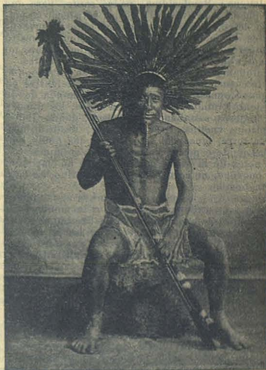
Un cacique de la tribu de los Coroados (Matto Grosso-Brasil).

La iglesia adornada, el altar iluminado, tres campanas que ensordecían á porfía el ambiente, la actitud de satisfacción que se veía en los hombres, el apurarse de las mujeres, no dejaba dudar acerca de la intención de los habitantes; ésto es, que aquel era día de gran fiesta y que el Señor Obispo debía pararse.