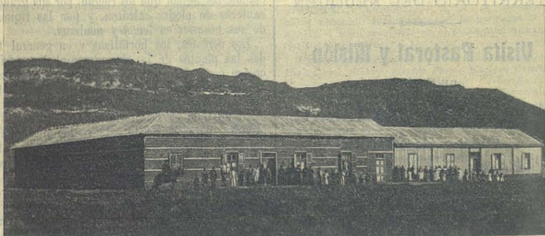
Casa de Junin de los Andes.

Con admirable acierto supo coordinar el horario de los oficios de la Semana Santa con el de los ejercicios piadosos y pláticas de la misión. Se predicaban al día tres sermones, se explicaba la doctrina cristiana á los niños y niñas de la parroquia, para prepararlos á la Primera Comunión y al Sacramento de la Confirmación. El Jueves Santo los vecinos de Junin presenciaron por primera vez una función muy devota é imponente: La solemne misa pontifical (con asistencia de cuatro sacerdotes y dos acólitos) y la consagración de los Santos Oleos . La procesión del SS. Sacramento al sencillo, pero hermoso Monumento, preparado al efecto, despertó los más vivos sentimientos de cristiana piedad, y llamó mucho la atención de los buenos feligreses