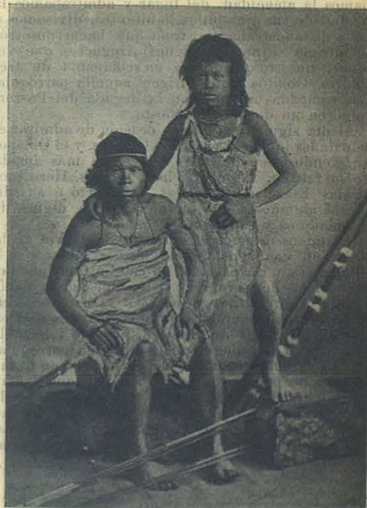
Jóvenes de la tribu de los Corcados (Matto Grosso-Brasil).

Destácase allá en una altura, un edificio de estilo mixto, de doble y vasta escalinata que adorna su base, con dos órdenes de ventanas superpuestas, con una hermosa cúpula que le corona. Está todo