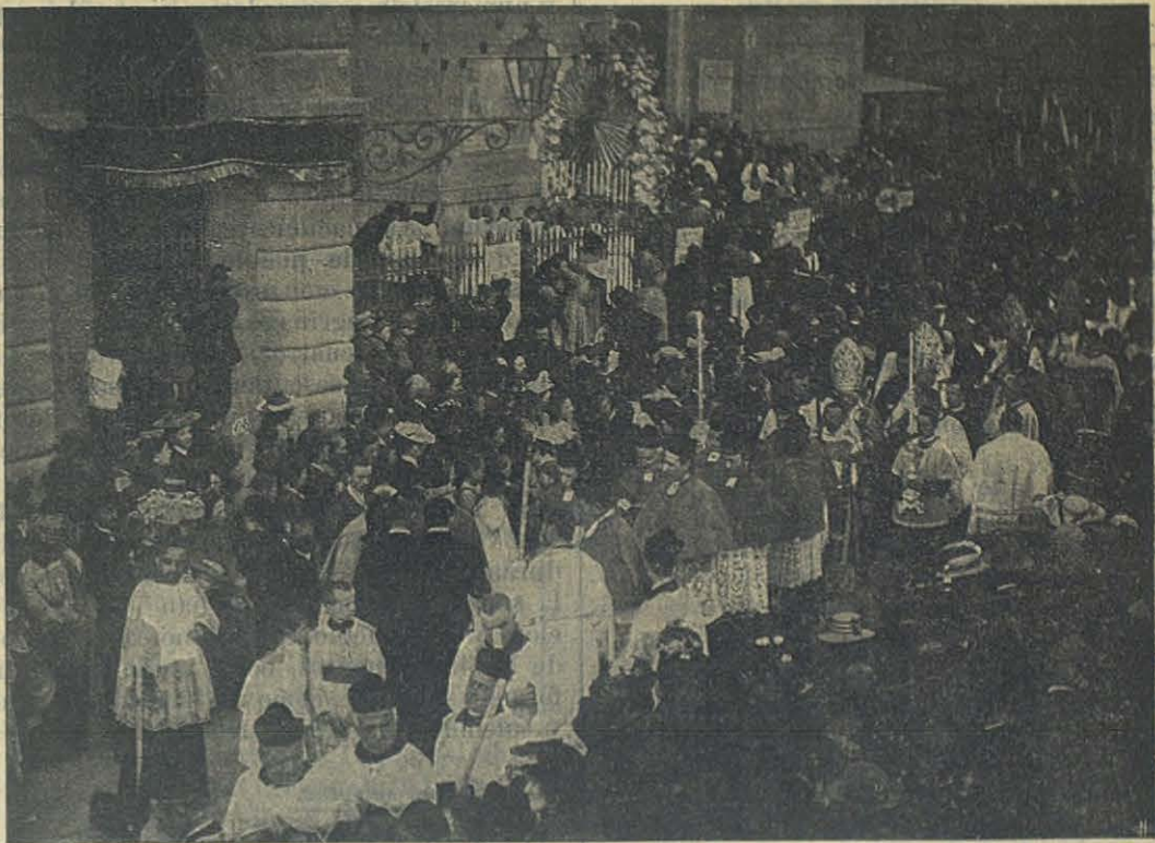
La Procesión — El Clero y los Prelados.

el mundo, los millares y millares de devotos que agradecidos se postran ante ella, el porvenir de esta devoción tan fructosa y simpática; pasaremos nosotros, y María quedará siempre allá arriba bendiciéndonos, pasarán nuestros hijos, pasarán nuevas generaciones como pasaron tantas, y María estará siempre sonriente bendiciendo á las generaciones que pasan y esperando á las generaciones que