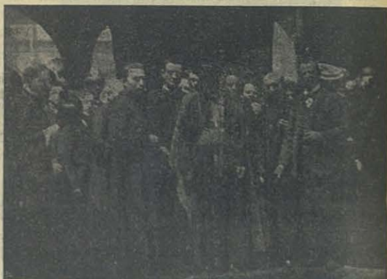
Salida de los Prelados del Congreso

He acogido con sin igual placer la noticia de que dentro de pocos días se reunirá en Turin el Tercer Congreso General de Cooperadores Salesianos. El vínculo especial que desde hace poco tiempo me une al benemérito Instituto de Don Bosco, me haría desear hallarme presente á la asamblea: pero circunstancias especiales no me lo permiten. No obstante me halaga la noticia de que el Congreso será honrado con la presencia de cuatro Emmos. Cardenales, Colegas míos y de muchos Reverendísimos Obispos. Tengo por inútil decir que hago votos por el buen éxito; la San-