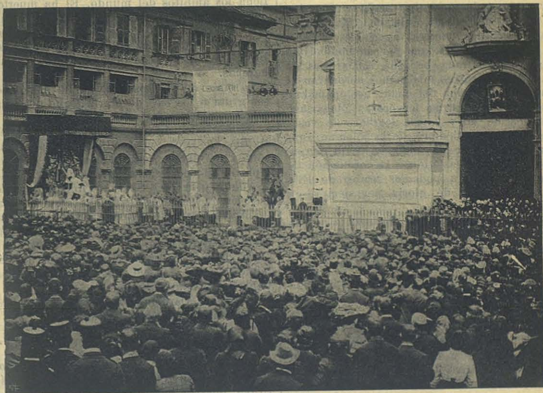
La Coronación de la Estatua — Vista de la Plaza.

Sea mi última expresión para vos, venerado D. Bosco, ciudadano cosmopolita que