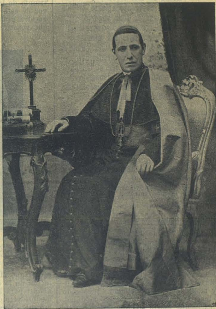
S. E. el Cardenal Rampolla, Secretario de Estado de S. S. y Protector de los Salesianos.

transformado por una Comisión de peritos ingenieros en salón de actos para el Congreso, capaz de dar cabida á 2000 personas. La sobria y elegante decoración de listas y florones de oro en fondo blanco; las tres galerías tapizadas con festones y colgaduras de terciopelo encarnado; las plantas y flores que el gusto y el arte distribuyó acá y acullá en varios sitios del salón, le prestan un aspecto