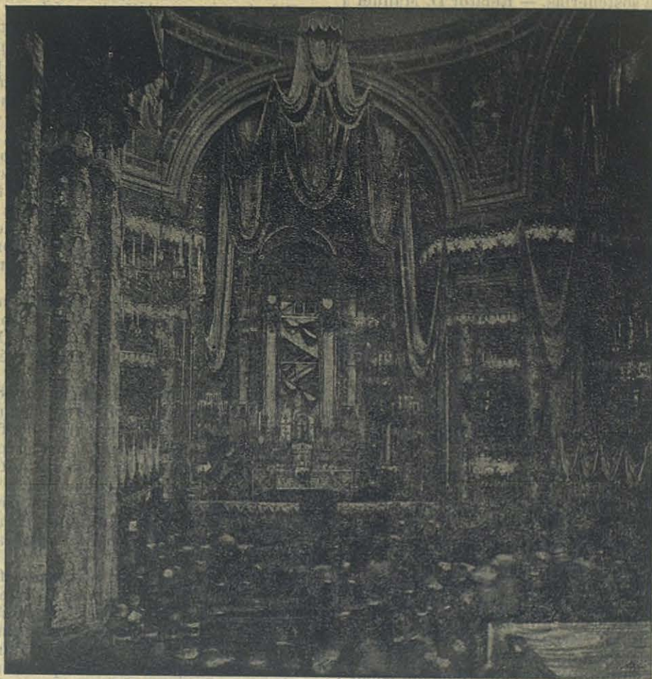
Interior del Santuario de María Auxiliadora antes de la Coronación.

rante los días del Congreso las cuatro Secciones, que estaban encargadas de discutir la parte práctica del programa, y de tomar las decisiones que después debían comunicarse á la Asamblea reunida. El trabajo de las secciones había comenzado antes y continuó después del Congreso; pero durante los días que éste duró pudieron tomar parte activa también los congresistas.