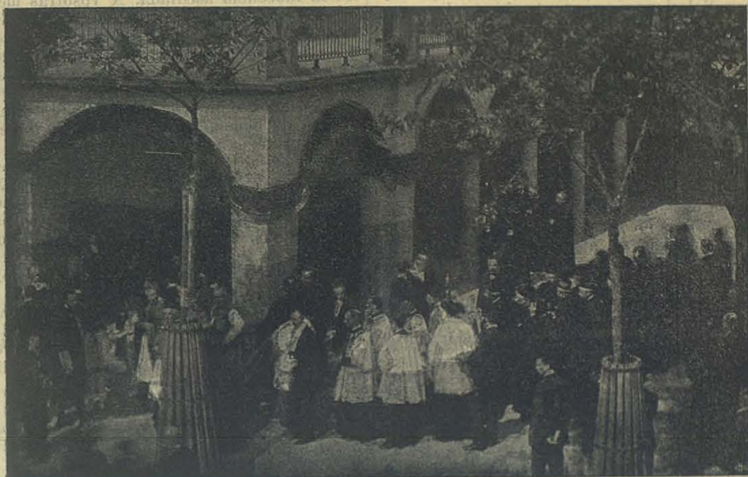
El Desfile del Cortejo — El Cardenal Richelmy y los Superiores Mayores.

Delinea el programa de una escuela reli-