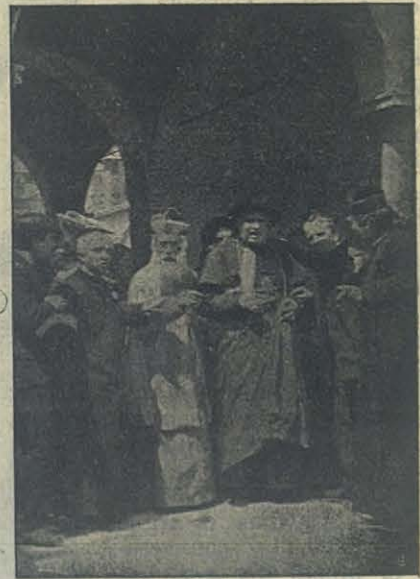
Salida de los Obispos del Congreso.

La mano bendita y piadosa del Emmo Cardenal Arzobispo de esta diócesis en nombre de S. S. León XIII, pondrá sobre la frente de la augusta Imagen la preciosa corona, per antes se elevará hasta el trono de María Auxiliadora, como perfume de flores, como triunfo de luz, como armonía de acentos, la voz de este Congreso, que es el himno de vuestra gratitud, beneméritos Cooperadores, que vosotros alzáis por las gracias innume-