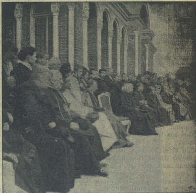
Los Prelados á la tumba de Don Bosco en Valsalice.

Presidente Efectivo: El Rdisimo. Sr. Don