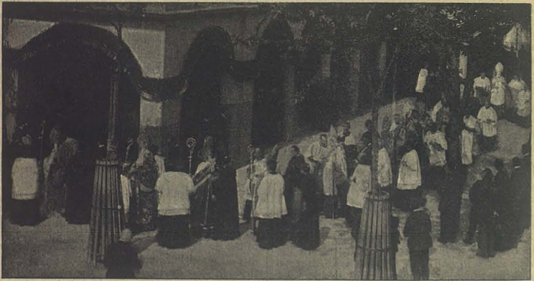
El desfile de los Obispos yendo á la iglesia.

Antes de la venida del Salvador el trabajo de los brazos era abyecto, sólo era noble el