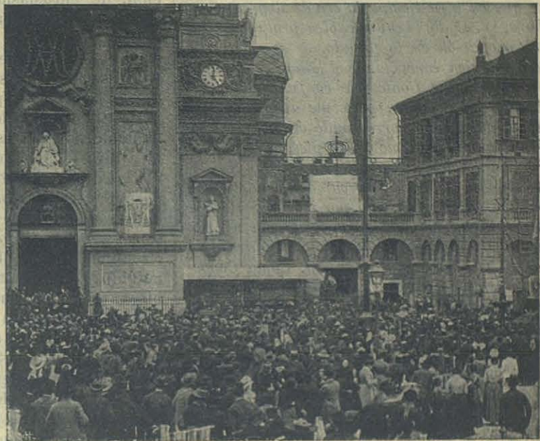
La salida de la iglesia.

Mi único argumento es la Coronación de María