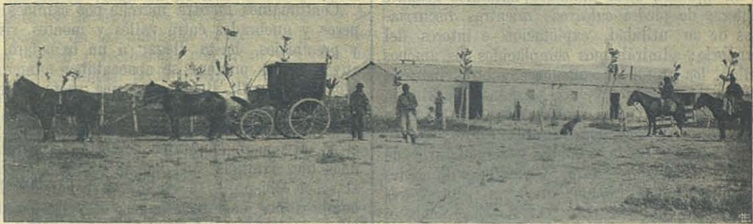
Estancia Pavia en Cohunco.