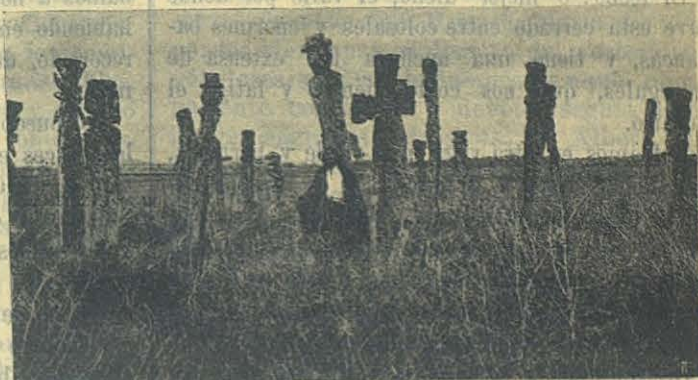
Cementerio de Indios del Nequén.

Íbamos perdiendo de vista la cordillera de Chachil y Las Lapas , y se nos presentaban nuevos horizontes, en cuyo fondo veíamos elevarse alta y erguida en forma cónica la cordillera de Chapelcú y el soberbio cerro Lanin , cuya cúspide parece tocar los cielos. Tiene 3.700 metros de altura: sus faldas están cubiertas de lava, pues, ha sido anteriormente un terrible volcán: presentemente sólo sabe de vez en cuando respirar , echando de su cráter globos de humo. Con sus eternas nieves, sirve como de luminoso faro á los viajeros, que la contemplan con maravilla, desde más de cuarenta leguas de distancia.