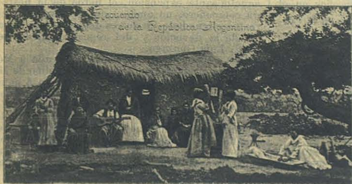
Habitacion de Quili-Malal.

Habilitamos para capilla una rústica vivienda con tapias de adobes y cubierta de carrizo y la decoramos con colgaduras que llevábamos al efecto. Nos la proporcionó un buen Mendocino, el cual tuvo que reconcentrarse juntamente con su