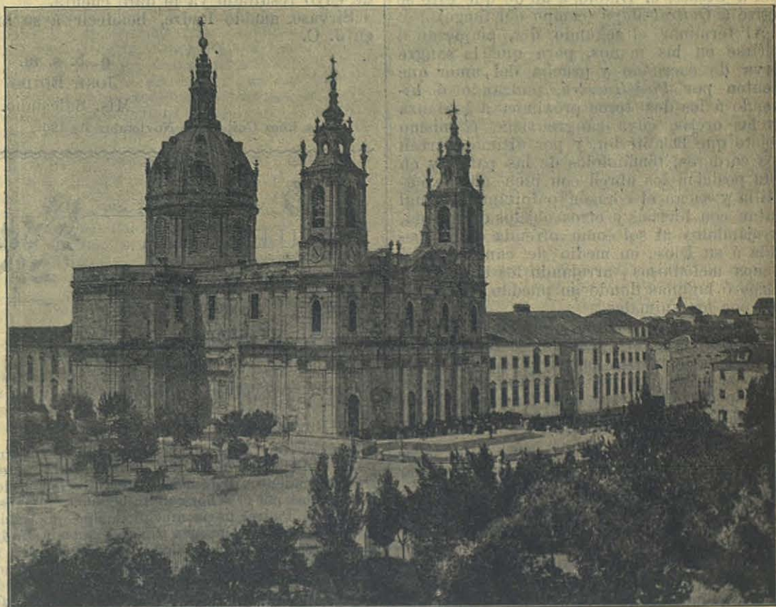
Basilica del S. Corazón de Jesús en Lisboa (Portugal).

clavan en el centro una larga lanza y cerca de ella atan dos toros; esta lanza debía ser el centro de dos circunferencias concéntricas. La interior formada por la rueda de las mujeres y la exterior por la de los hombres, los cuales giran alrededor de la lanza con banderola encarnada por espacio de casi dos días, acompañando este continuo movimiento lleno de pequeños saltos con monótonos cantos á Antú (El Sol) para que lo trasmita á Picá-