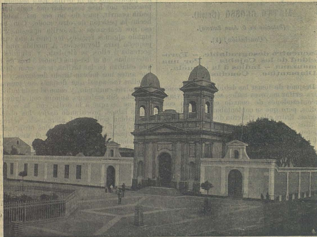
Capilla del Colegio D. Bosco en Callao (Perú) dedicada á la Inmaculada Concepción.

quista D. Silvio. El día 30 nos visitó una turba de indios, ya conocidos, y los pobres, solamente por ver al Misionero, habían tenido que andar 10 ó 12 días de camino. Aprovechando sus buenas disposiciones, me senté en medio de ellos y aprendí algunas palabras del idioma que ellos hablan. Pregunté al que mejor pronunciaba las sílabas, y después las apunté en un cuaderno, alegrándose ellos mucho al oírme pronunciar su idioma: se admiraron sobremanera al ver que escribía con un lápiz negro en el papel blanco: para