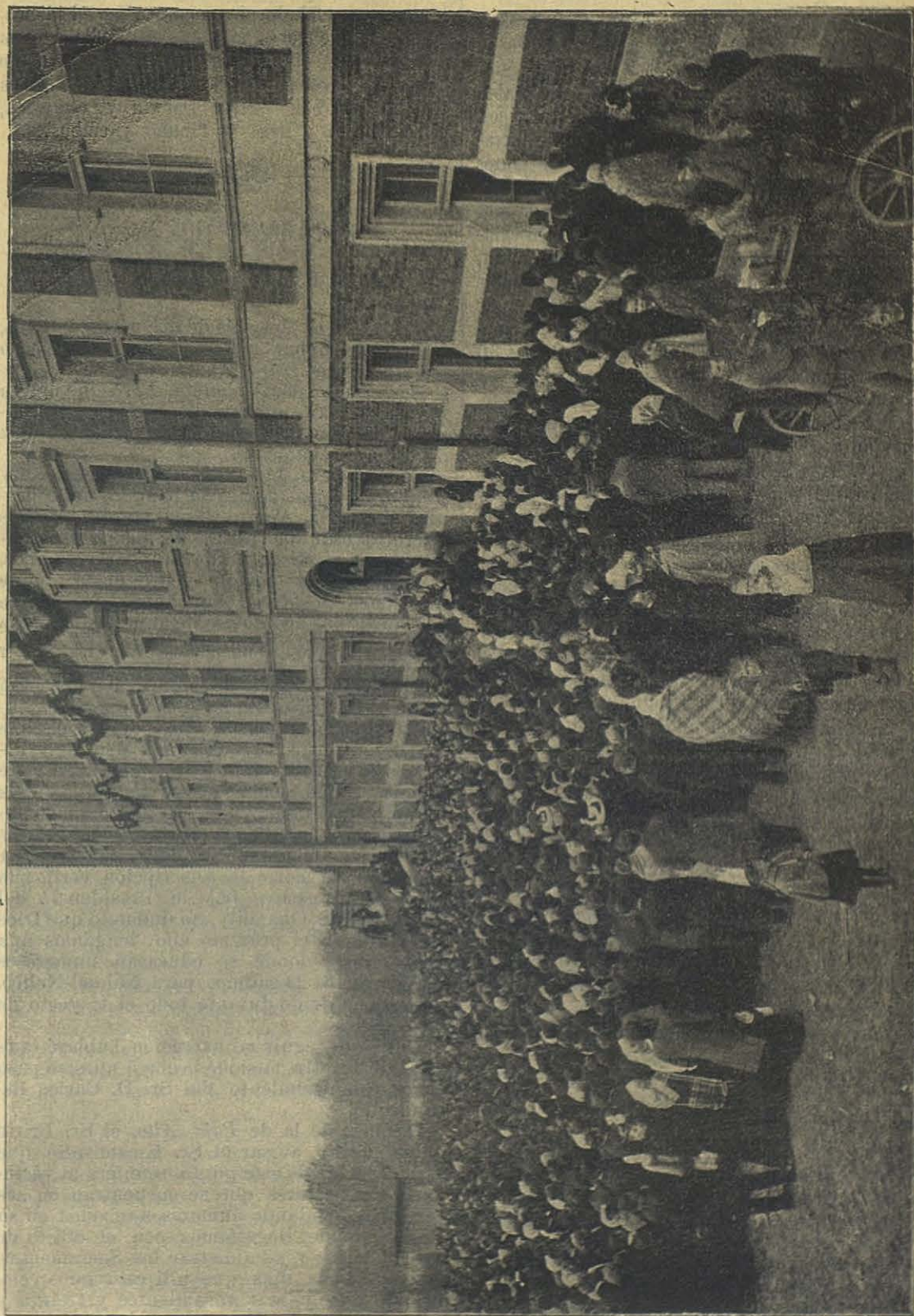
Inauguración de la nueva Casa de Oswiecim.