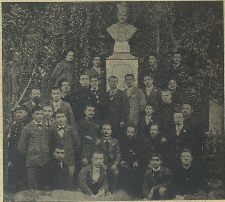
Antiguos alumnos del Oratorio Salesiano de Eckmühl (Algeria).

Ascona (Suiza). — El día 5 del pasado Abril visitó esta Casa nuestro amadísimo Rector Mayor. Ya supondrán nuestros lectores el entusiasmo que reinaría en todos. Después de las fiestas religiosas hubo academias etc. etc. D. Rúa fué visitado por todas las autoridades, tanto civiles como eclesiásticas, y todos desde luego deseaban escuchar de sus labios una palabra de consuelo. No faltaron