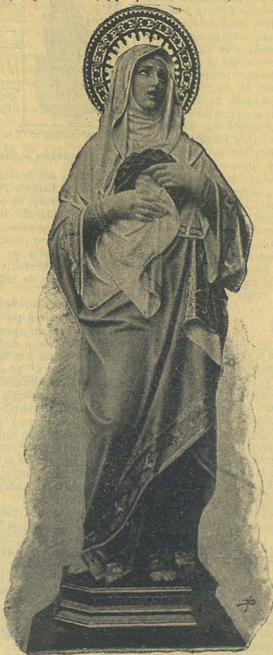
Nuestra Sra. de los Dolores.

¡Farsantes! ¿Seguirán las calumnias? ¡Quién sabe! Pero por si acaso esto sucediera, entiendan bien esos señores pasados, presentes y futuros, que han esgrimido, esgrimen ó esgrimirán arma tan poco noble, que yo seguiré en mi camino sin detenerme ante ninguna dificultad, venciendo, con la ayuda de Dios, todo obstáculo que se presente, despreciando todo embuste