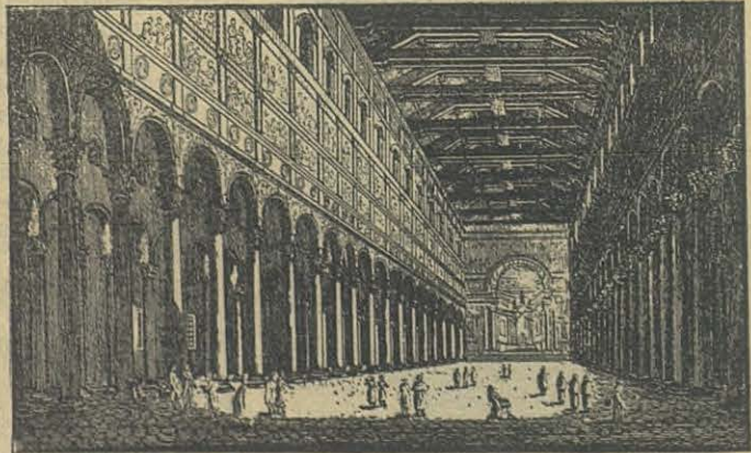
ROMA. — Interior de la Basílica de S. Pablo.

GRACIAS á la munificencia de los Sumos Pontífices, álzase á unos dos kilómetros de