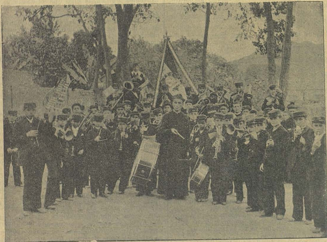
LIMA (PERÚ).—Banda de música del Colegio Salesiano.

Ayudarlos en la obra en que se hayan empeñados, es deber de todo católico y de todo patriota;