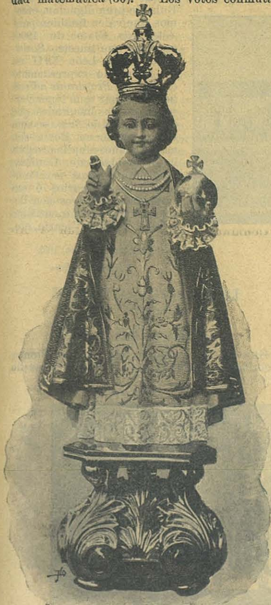
El Santo Niño de Praga.

Solo dentro del tribunal de la Penitencia se puede hacer esta conmutacion (29), y se han de conmutar en obras poco más ó menos equivalentes; si bien no se exige una igualdad matemática (30). — Los votos conmuta-