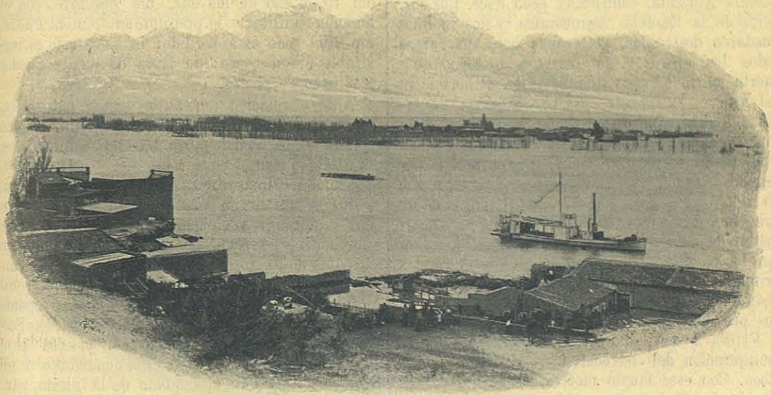
Viedma inundada. — 27 de Julio de 1899.

Estas noticias nos alegraron á todos, y quitaron á nuestro corazón el enorme peso que lo oprimía; el horizonte empezaba á despejarse, por lo que, aumentando nuestra confianza en Dios, continuamos con mayor ardor tomando providencias para prevenir ó aminorar en lo posible los peligros que nos amenazaban.