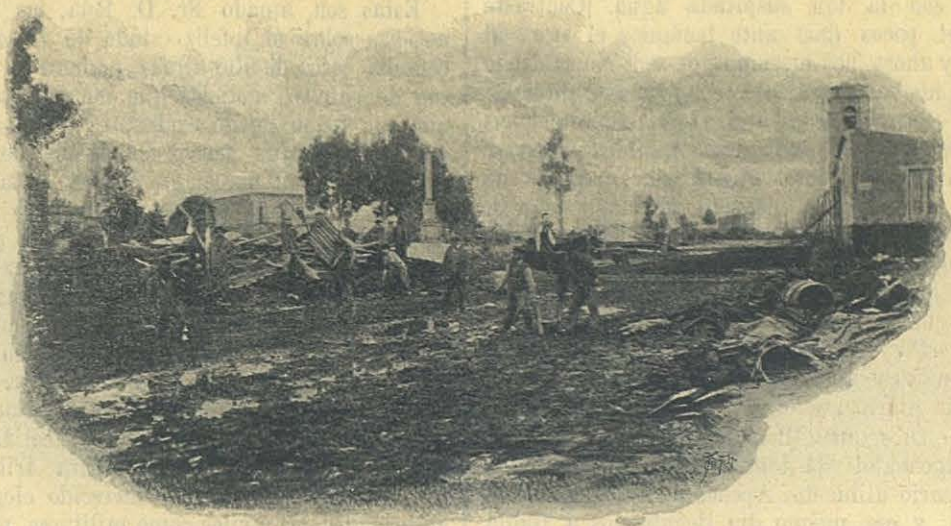
La Plaza Winter, frente al Colegio Salesiano de Viedma.

Quince días, que se nos hicieron eternos, permanecimos en la Sierra , sufriendo lo que no es decible, no obstante lo acostumbrados que estamos á sufrir privaciones. No teníamos tiendas de campaña, ni aun para las Hermanas, y con sólo 24 K. de carne al día, que era la única ración