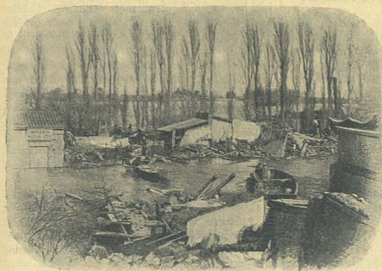
La Calle Roca en Patagoncs.

las aguas se habían ya retirado casi por completo, y si no lo hizo antes, en los días de mayor peligro, fué porque su presencia nos era más útil y necesaria en Buenos Aires, para informar al Gobierno del lastimoso estado de estos valles, y mover y despertar la caridad pública en nuestro favor. Y el resultado que S. Ilma. obtuvo en sus gestiones, no pudo ser más lisonjero, tanto que los primeros socorros que nos llegaron fueron fruto de ellas. Sirviéndose de la prensa, desparramando multitud de circulares, visitando frecuentemente á las autoridades supremas y á familias particulares, recurriendo á las Asociaciones de beneficencia y echando mano de mil otros recursos que supo sugerirle su celo y ardiente caridad, el Ilmo. Sr. Cagliero logró aliviar en mucho la miseria y el abandono de los pobres inundados. Más tarde, cuando llegó á Viedma, no se dió punto de reposo, visitando á los damnificados, yendo de familia en familia acompañado solo de su secretario, para enterarse mejor y por sí mismo de las necesidades de cada uno, y en una palabra, animando y consolando á todos.