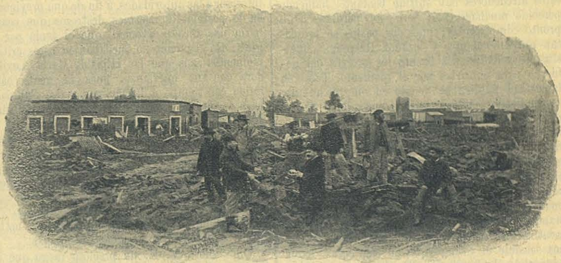
Ruinas de Viedma. — Agosto de 1899.

Al poco rato se me presentaron las Hermanas,