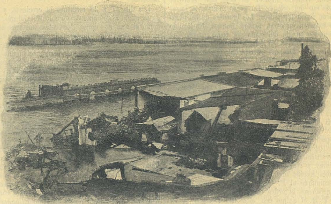
Vista de Patagones inundado.

El pobre náufrago entre tanto lloraba y soli-