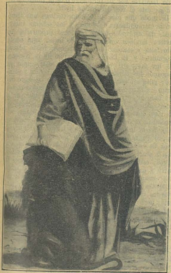
S. MARCOS EVANGELISTA

Un jefe no vuelve atrás por tan pequeña difi-