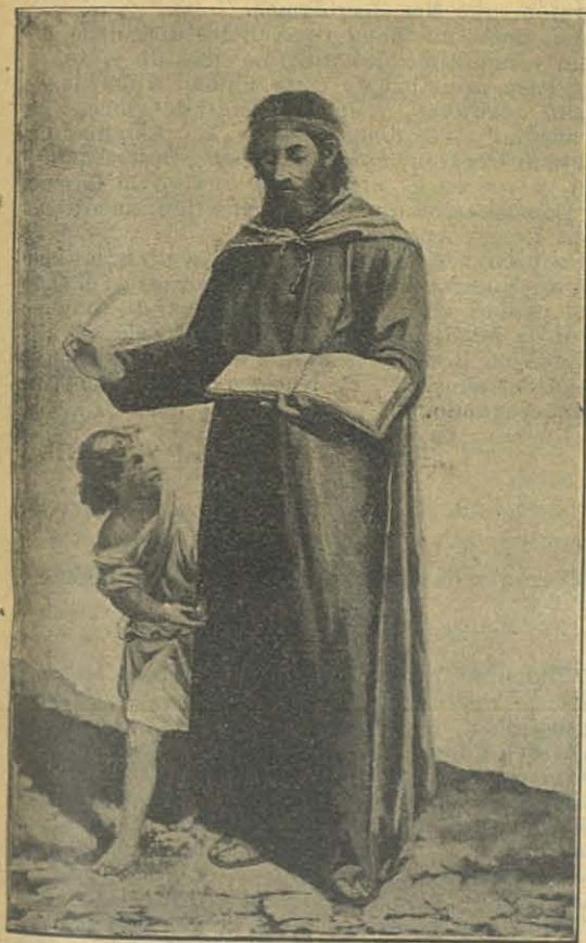
S. MATEO EVANGELISTA

Y no consiste todo solamente en esto. Cristo manda no sólo con derecho nativo, por ser el Unigénito de Dios, sino tambien con otro adquirido. Él nos libró del poder de las tinieblas (1), y tambien se entregó en redencion á sí mismo por todos (2). Por ello se hicieron pueblo de adquisicion para Él (3), no sólo todos los cristianos y católicos bautizados debidamente, sino tambien