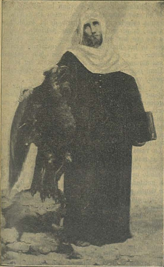
S. JUAN EVANGELISTA

Este día... ¡cuán bello! ¡cuán simpático! El alba, more solito , fué saludada con repiques de campana (que son dos piezas de una máquina despedazada); disparos — en lugar de cohetes, poco conocidos en