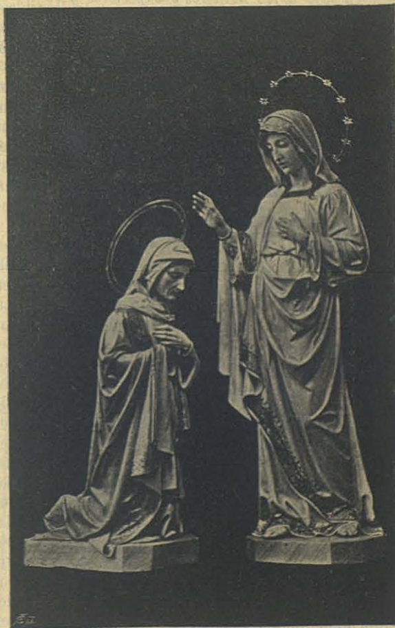
La Visitacion de Ntra. Sra. (2 de Julio.) (Escultura de las Escuelas Salesianas de Sarriá.)

» Haces muy mal en creer que te olvido; el escribirte todos los días, como dices en tu última,