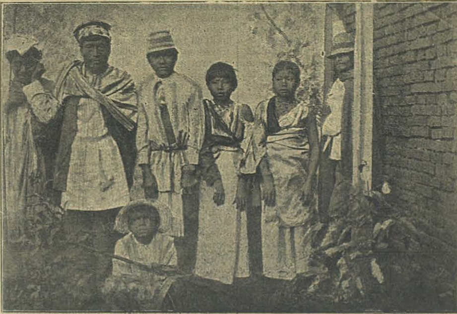
Indios Caingüá del Paraguay.

Digan si María fué el Auxilio de los Cristianos las muchas herejías que vinieron á conturbar al pueblo fiel durante los siglos. Ounctas hæreses sola