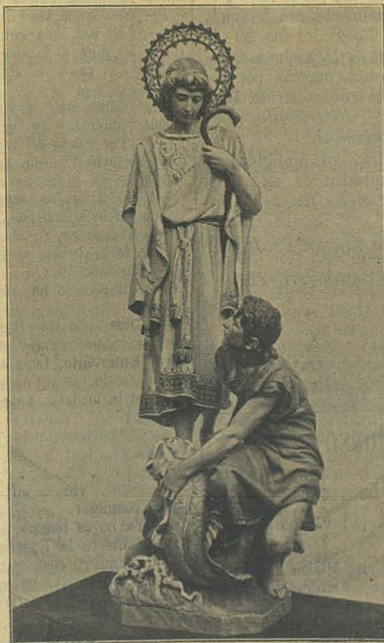
S. Rafael Arcángel (24 de Obre.)

Me alojé en la cabaña de algunos seringueiros ó sea hombres dedicados á extraer la goma elástica, los cuales me ofrecieron su casa si quería volver á vivir con ellos, pero por la falta de medios y lo difícil de emprender todavía con esperanzas de éxito la conversion de los indios, no pude aceptar su generoso ofrecimiento, pero si acepté con gusto su compañía hasta Cuyabá para donde debían artir dentro de algunos días.