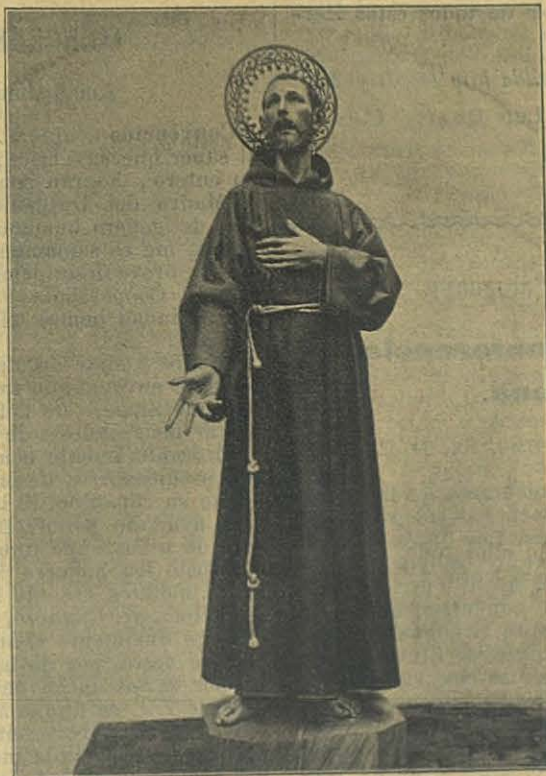
S. Francisco de Asís (4 de Obre)

(Escultura de las Escuelas Salesianas de Sarriá)