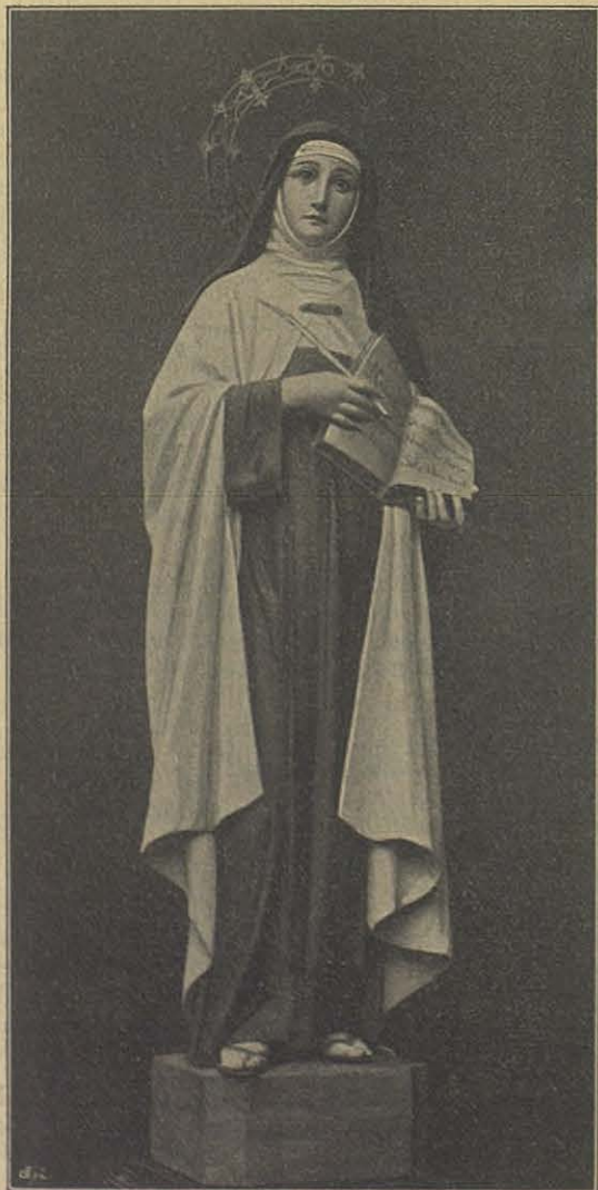
Santa Teresa de Jesús

No dejaron por eso su afición á la lectura, sino que continuando con más ahínco leyendo las vidas de los santos,