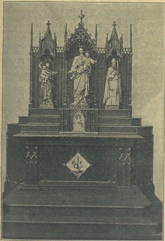
Altar é imágenes de la Capilla Salesiana de Béjar.

« Tambien se ha aumentado el número de asilados llegando á 325, de los que 77 son internos: los restantes acuden diariamente á recibir una buena educacion. Los primeros estan completamente á cargo de los Padres Salesianos; á los segundos no pocas veces se les debe suministrar vestido, comida, y objetos de clase, siendo tan ex-