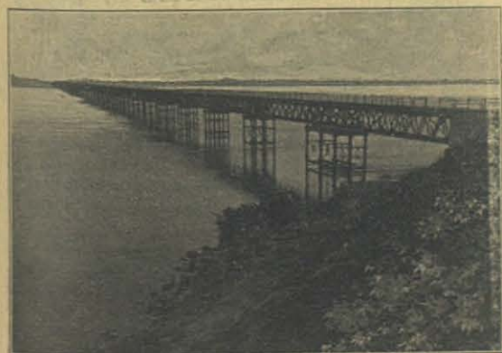
Puente de hierro sobre el Bio-Bio. — Concepción.

Uno de los principales atractivos de la actuación era el estreno de la banda de música, compuesta por 34 de los alumnos internos del establecimiento. Tocaron diferentes piezas musicales, y en todas ellas merecieron las justas demostraciones de aprobación de la concurrencia que los escuchaba con verdadero entusiasmo. Este resultado es aún más digno de admiración y de encomio, si se tiene