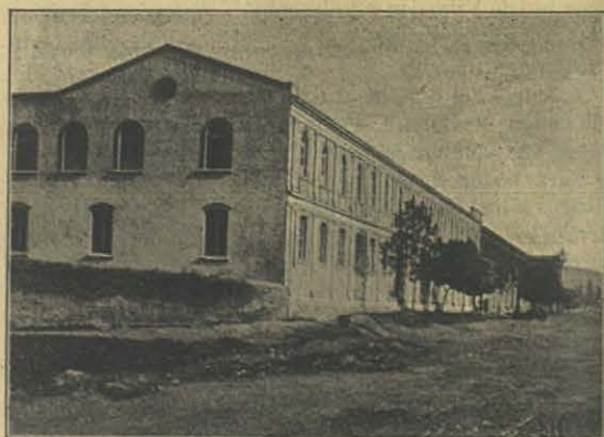
Talleres Salesianos de Concepción (Chile).

Nuestra numerosa banda infantil esperaba á su Ilma. en la estación y saludó su llegada con la mejor marcha de su repertorio. Pintoresco efecto producían los músicos en su regreso al Colegio, rodeados de niños que llevaban en sus manos hermosos farolitos chinoscos.