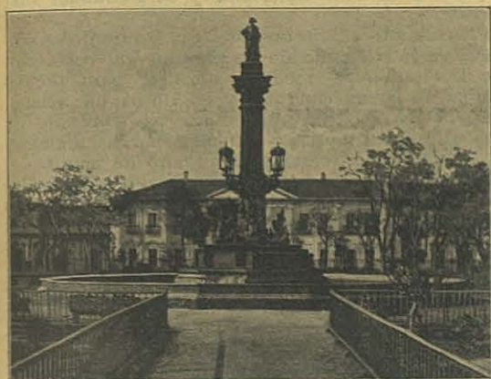
Plaza de Concepción.