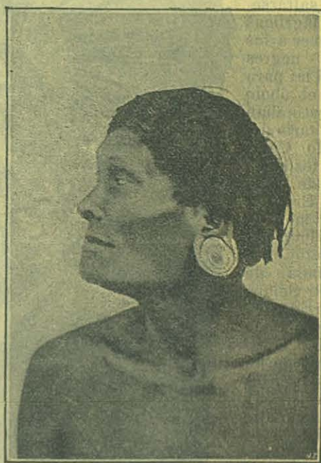
BOTOCUDOS (cerca del Puerto de Angicos, en el Brasil).

dificultades, se realizará esta empresa entre nosotros, como se edificó en Francia el santuario de Nuestra Señora de la Guardia en Marsella, y de Nuestra Sra. de Fourvières en Lyon, y como se han edificado otros semejantes, en que se manifiesta la intervención de la Providencia, en diversas naciones.