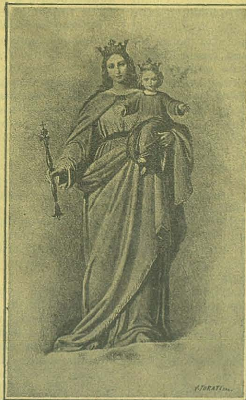
MARIA, AUXILIUM CHRISTIANORUM, ORA PRO NOBIS.

das en él? Hay más. Ante el altar de María Auxiliadora han ratificado sus votos y promesas centenares de religiosos, allí han implorado solemne bendición tantos y tantos misioneros é Hijas de María Auxiliadora al partir para las Misiones, y millares de niños que recibida educación cristiana se han esparcido en diversos países, y llevando esculpida en su pecho la devoción á la Madre de Dios la han comunicado á sinnúmero